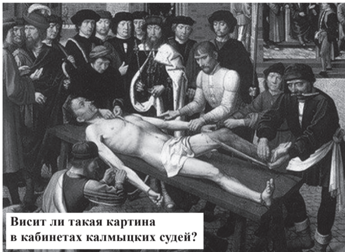
Висит ли такая картина в кабинетах калмыцких судей?

Это произведение обязательно должно висеть в офисе каждого судьи!